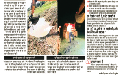
खनिज विभाग की कार्यप्रणाली पर सवाल: सबसे बड़ा सवाल खनिज विभाग की कार्यप्रणाली पर उठता है। खनिज अधिकारी किसी का फोन

अखबार में खबर के प्रकाश के बाद भी माफिया का पावर शासन और प्रशासन से भी बढ़ा हो चुका है।