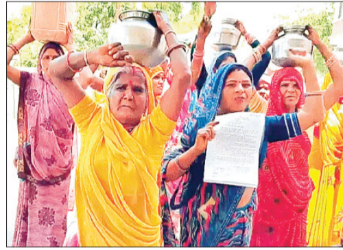
हरिभूमि न्यूज | सीहोर

2 किमी दूर झिरी खोदकर पीने को मजबूर ग्रामीण। नए बोर के लिए 5 विभागों की मंजूरी का पेंच