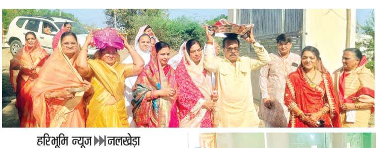
नलखेड़ा