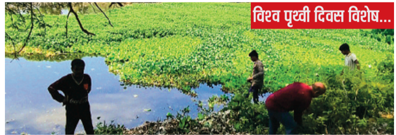
विश्व पृथ्वी दिवस विशेष...

सीहोर। आज जब पूरी दुनिया विश्व पृथ्वी दिवस मना रही है और पर्यावरण संरक्षण की बड़ी-बड़ी कसमें खाई जा रही हैं, तब सीहोर शहर की पहचान और यहां की जीवनदायिनी 'सीवन नदी' अपने अस्तित्व की लड़ाई लड़ रही है। कभी निर्मल जल के लिए जानी जाने वाली यह नदी आज गंदगी, सीवेज और प्रशासनिक उदासीनता के कारण एक नाले में तब्दील होती जा रही है।