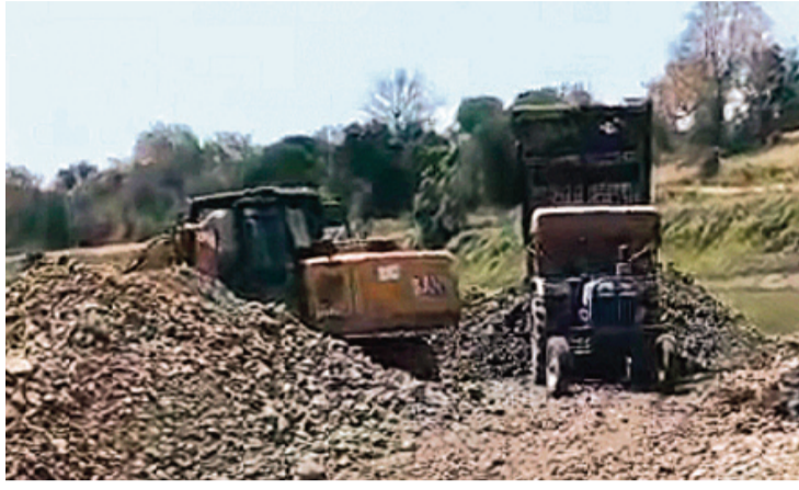
सुरक्षा बलकलेन से कलकत्ता आकर रात में ही पकड़ कर ली गई थी।

सेकनपुर में इन माफियाओं की भारी मशीनों और ओवरलॉड ट्रैक्टर ट्रॉली ने ग्रामीण इलाकों की सड़कों का दम निकाल दिया है। करोड़ों की लागत से बनी सड़कें अब सिर्फ धूल और गड़ों का ढेर रह गई हैं। आलम यह है कि सड़क पर डामर ढूँढने से भी नहीं मिलता, लेकिन इन उजड़ी हुई सड़कों पर दौड़ते ट्रैक्टर ट्रॉली अधिकारियों की नजरों से अछूला है।